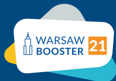
Warsaw Booster 2021 I miejsce

Zespół opracowujący zarówno aplikację, jak i materiały wspierające uzyskał następujące nagrody: